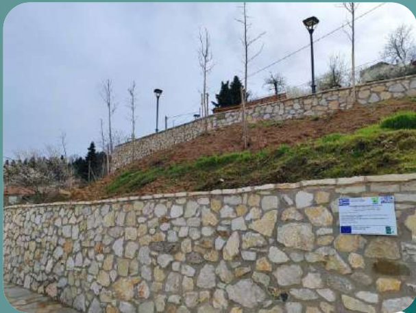
Αισθητικές παρεμβάσεις - αναπλάσεις οικισμών Δήμου Λίμνης Πλαστήρα (Μορφοβούνι-Νεοχώρι)