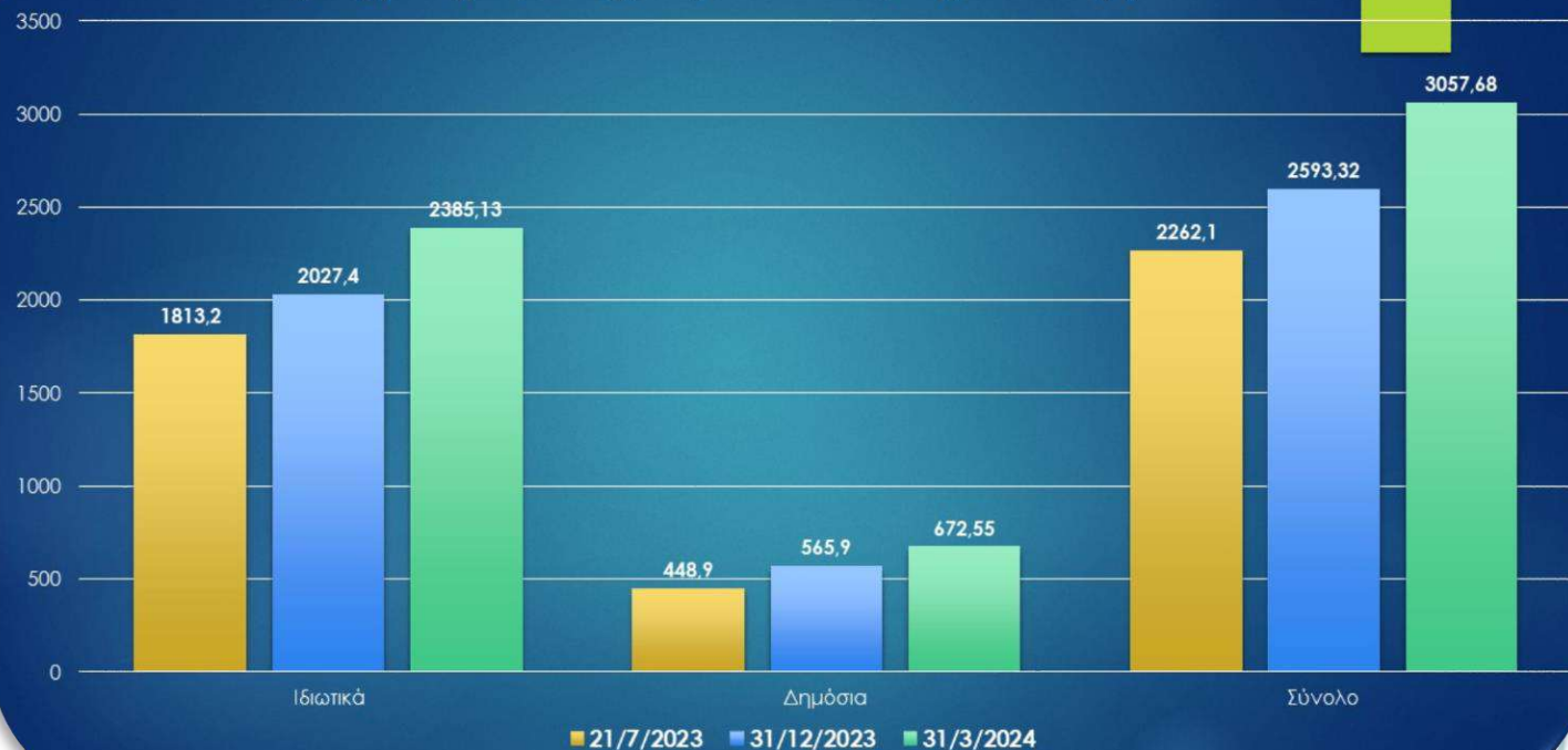
Εξέλιξη πληρωμών (χιλ.€) Ιδιωτικών/Δημόσιων έργων LEADER